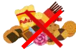
（不能带零食和点心等）