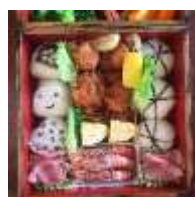
←← （运动会时全家一起吃的大弁当）