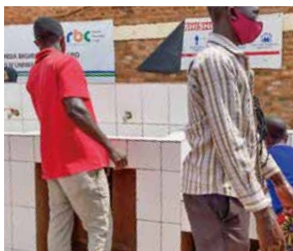
マーケットの前に、立派な手洗い場が誕生。

カガメ大統領の強力なリーダーシップと国民の努力の賜物です。そのおかげで、私たちJICA海外協力隊はルワンダに戻ってこれたのです。ほんとうにムラコゼ(ありがとう)です。