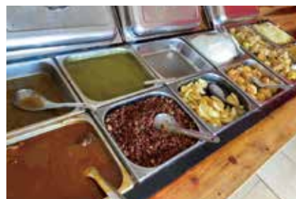
行きつけのレストラン。これがルワンダビュッフェ。

(注)キャッサバ…東南アジアやアフリカでもよく食される中南米原産のイモ。日本でも知られるようになった「タピオカ」の原料。