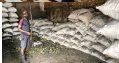
炭の専門店では、会計を改善中。