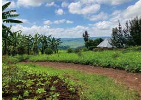
家のすぐ裏には、こんな絶景が。さすが、千の丘の国。

顧客を獲得する方法や新しいサービスを考え、どうしたら利益が出るのか、ルワンダ人と一緒に頭をひねる日々です。