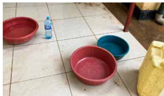
雨水を溜めている様子。雨季最高。

私の住む地域では、1年以上も水がでませんでした。蛇口から水が出てこない生活を想像してみてください。本当に困るはず。手は洗えませんし、トイレも流せません。もちろん、シャワーも浴びれませんし、料理も洗濯もできないのです。