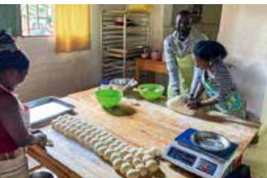
パン屋の 売上拡大を サポート中。