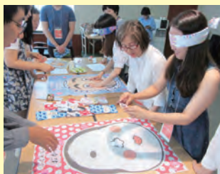
富川大学生と日本の福笑いので大笑い