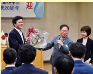
富川市の「花」と「木」である「桃」の工芸盆栽を、富川市長に贈呈

KIFA(かわさき国際友好使節)にも認定された、川崎市民交流団(22名)が、友好都市 富川市では、市長表敬や市内見学のほか大学生と日本の遊びや茶道を通じて交流を行いました。地理的に最も近く、市民交流が最も盛んな友好都市・富川との絆がさらに深まりました。