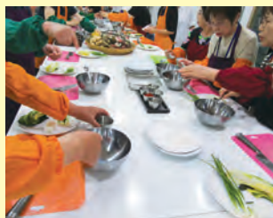
「キムチ作り体験」五感を使って文化理解