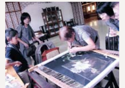
▲蘇州の刺繍研究所を見学