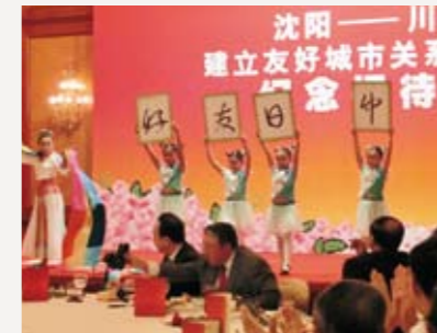
▲瀋陽市による歓迎レセプション