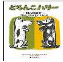
Harry the Dirty Dog

Hãy đến đọc truyện tranh cùng con và dùng những quyển sách ấy giúp ích cho việc học tiếng Nhật của bạn nhé!