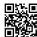
Trang chủ Hiệp hội Giao lưu Quốc tế Thành phố Kawasaki

*Tư vấn miễn phí với Chuyên viên Luật hành chính (Chỉ nhận tư vấn bằng tiếng Nhật nhưng bạn có thể đặt hẹn phiên dịch. Có tính phí)