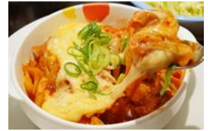
(รูปภาพประกอบ)

ค่าธรรมเนียม: 1,568 เยน (ชำระในวันงาน) มีบริการดูแลเด็ก (เด็กอายุ1 ปีขึ้นไปต้องแจ้งล่วงหน้า)