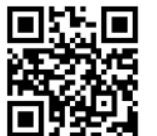
가와사키시 국제교류협회 홈페이지