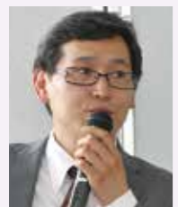
2005年 第11回スピーチコンテスト最優秀賞受賞(当時専修大学大学院)

また、スピーチの姿勢も変化していますね。以前はオーバー・アクションや派手な応援が目立ちましたが、最近はしっかりと自然体で、「本当にこれを伝えたい」という気持ちの強さが、人の心をつつスピーチになっています。